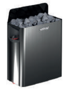
Электрическая Harvia SW45