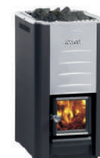
Дровяная Harvia M3 + дымоход