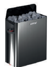
Электрическая Harvia SW45