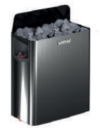
Электрическая Harvia SW45