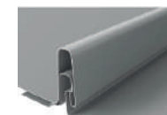
Уникальная конструкция замка